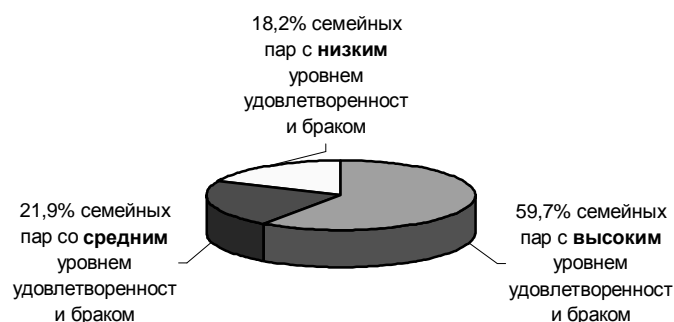
Рис.2. Удовлетворенность браком в молодых татарских семьях

Подавляющее количество исследуемых межнациональных семейных пар оценивает свой брак как удовлетворительный, причем, 43,9% семей оценили их высшей степенью (рис.3).