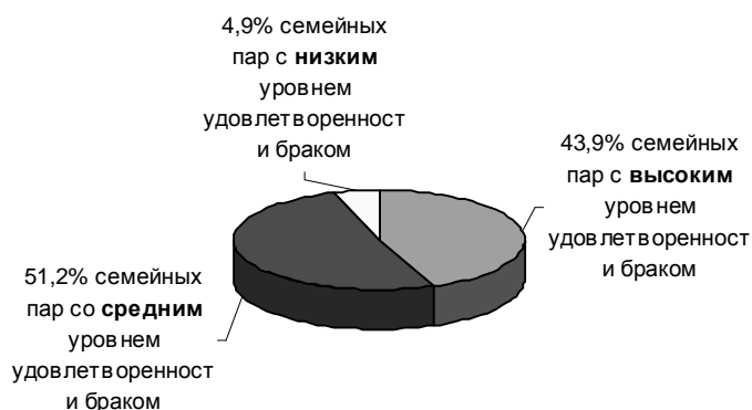
Рис.3 Удовлетворенность браком в молодых русско-татарских семьях

Подавляющее количество исследуемых межнациональных семейных пар оценивает свой брак как удовлетворительный, причем, 43,9% семей оценили их высшей степенью (рис.3).