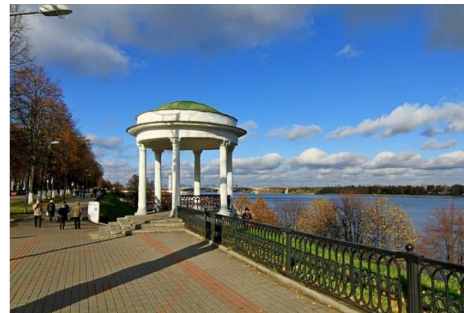
Набережная реки Волга