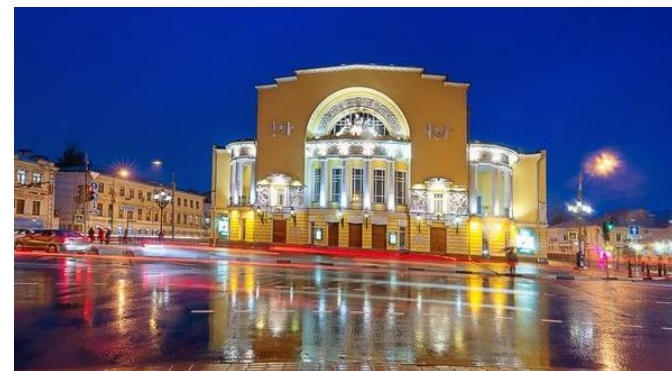
Академический театр им. Ф.Г.Волкова