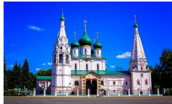
Храм Ильи Пророка

[2] J.P.Biersack, L.G.Haggmark, Nucl. Instr.and Meth. 174 (1980) 257.