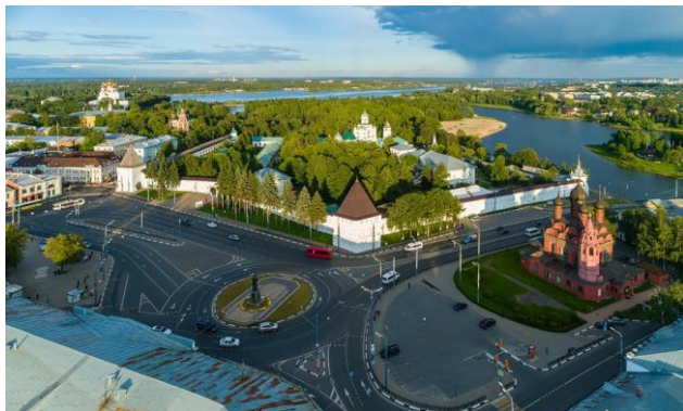
Вид центральной части г. Ярославль

На железнодорожном вокзале «Ярославль-Главный» будет организована встреча прибывающих участников конференции и доставка к местам регистрации и проживания.