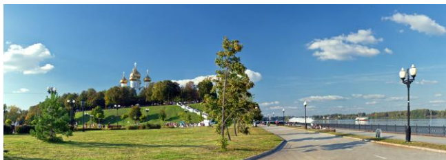
Стрелка и Волжская Набережная г. Ярославль

Ярославль основан более 1010 лет назад и является музеем Русской архитектуры, столицей городов “Золотого кольца России”. В свободное от работы конференции время будут организованы пешие экскурсии по городу и экскурсии в Толгский монастырь или в Ростов Великий. После окончания конференции 25 августа может быть организована 2-х дневная автобусная экскурсия по городам “Золотого кольца России”: Ярославль, Ростов Великий, Переславль, Москва. Заказ для участия в этой экскурсии можно сделать до 15 марта по E-mail: 26isi2023@mail.ru