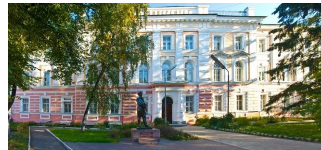
Ярославский государственный университет им. П. Г. Демидова

Конференция состоится в городе Ярославль, расположенном на живописном берегу реки Волги в 250 км к северо-востоку от Москвы. Регистрация участников (с 20.08.2023) и заседания конференции будут проводиться в Ярославском государственном университете им. П. Г. Демидова (ул. Советская, 14). Открытие конференции – в 9 утра 21.08.2023.