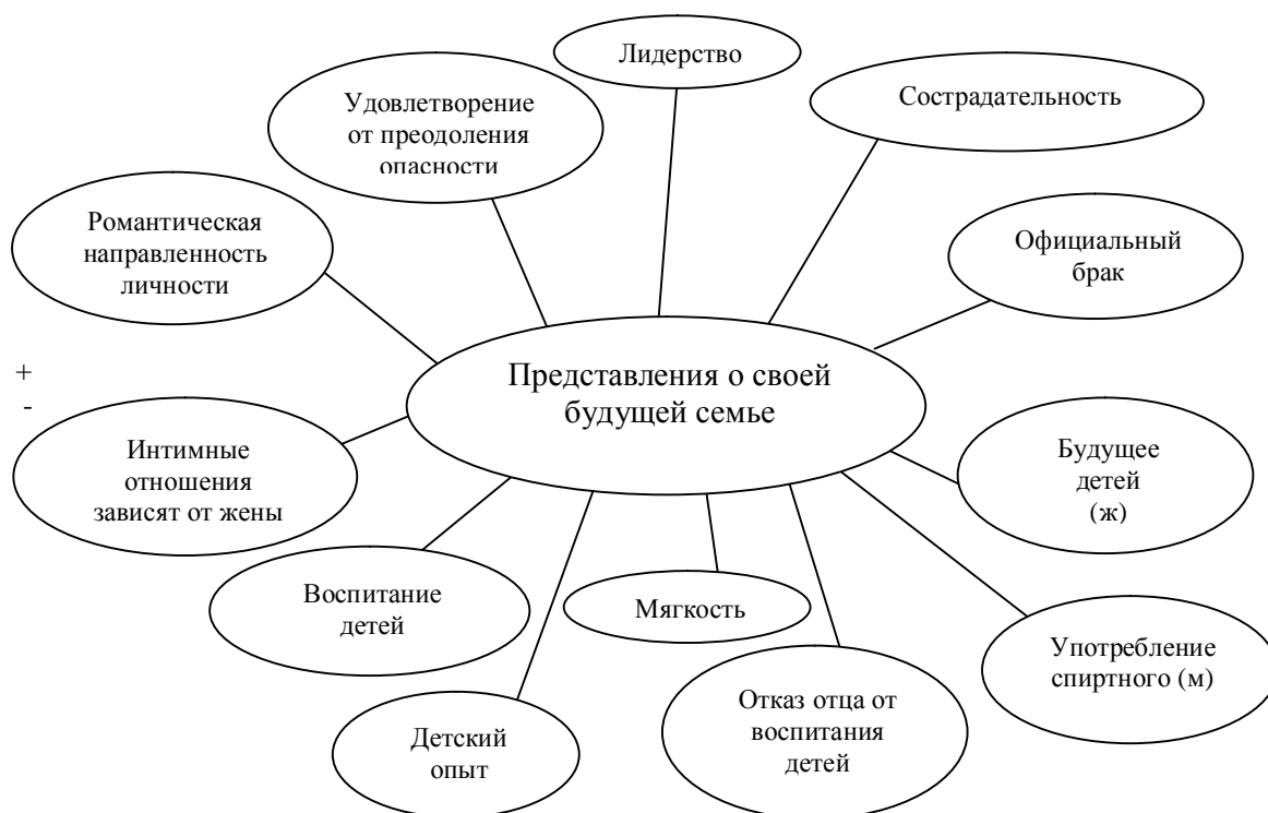
Рис.4 Корреляционный граф факторов, связанных с представлением юношей о будущей семье

Обобщая результаты, следует отметить, что идеализированные представления девушек о будущей семье, несмотря на прагматический характер реальных устремлений, сводятся к ожиданию мужского образа «принца на белом коне», соответствующего маскулинному стереотипу, то есть достаточно характерного для нашей культуры, дополнительно наделенного внешней красотой и испытывающего любовь к самой девушке.