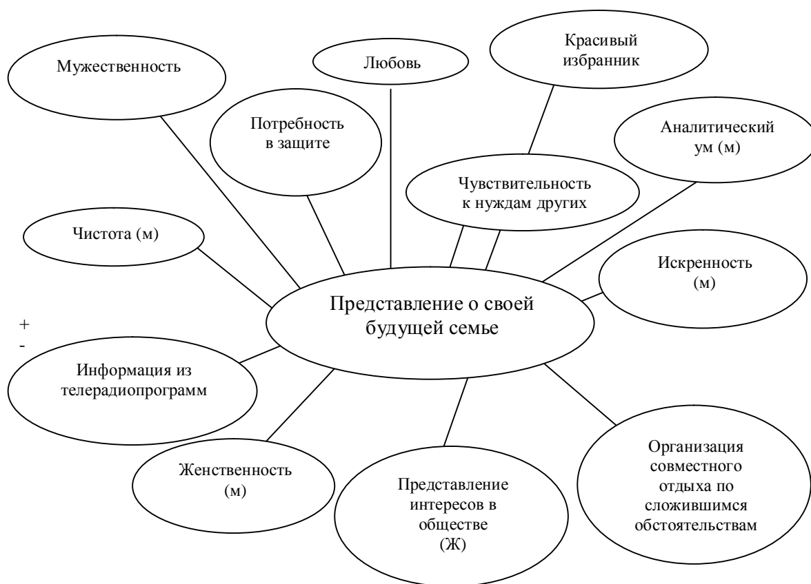
Рис.3. Корреляционный граф факторов, связанных с представлением девушек о будущей семье

Для юношей представления о будущей семье связаны, прежде всего, с романтической направленностью личности (рис.4). Такие представления ассоциируются с наличием официальных отношений, а иные формы семейных отношений не вписываются в картину семьи. Образ будущей семьи отражает не конкретные ее характеристики и параметра, а, прежде всего, эмоциональную направленность молодых людей и стремление рассматривать семью как источник получения желаемых эмоций.